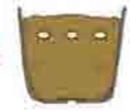
3号ポット(直径9cm)に3粒まき、発芽がそろったら2本に間引く。

育苗 鳥の被害が心配なら、ポットで育苗して、苗を畑に植えましょう。3粒まいて、生育の良い2本を残して1本間引きます。本葉が3枚くらいになって子葉がしぼんだら植え付けます。