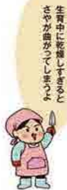
生育中に乾燥しすぎるとさやが曲ってしまう。

収穫 種類により異なりますが、インゲンの長さが13~15cmになったら収穫です。取り遅れると硬くなってしまうのであまり大きくなりないうちに収穫しましょう。ほぼ毎日収穫できるようになります。種まき時期が長いので、10日~2週間ほどずらして何度かに分けてまくと、最初の株が終わっても継続して収穫することが出来ます。