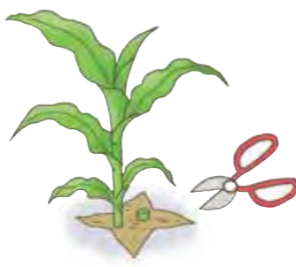
引き抜くと全部抜けてしまいがちなので、はさみで切り取る