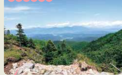
今月の表紙(撮影:7月下旬) 美ヶ原高原の物見石山付近より(武石地区) 浅間山方面を撮影

今月号の表紙の写真は、梅雨の合間を縫って美ヶ原高原へ撮影に行ってきました。気温30度の世界から高原のさわやかな風が頬をなで、少し涼し過ぎる別世界でした。撮影のために訪れたからか、年齢を重ねたせいなのかわかりませんが、抜けるような空と緑の丘陵、コントラストのはっきりとした牛たちの風景が何かグッときました。今週のパシヤリは、物見石山付近の路上から、浅間山方面に向けて撮影したものです。雄大なふるさとの風景を表紙にと思いましたが、部署内で検討したら圧倒的に牛が人気でした。今月の担当(今井)