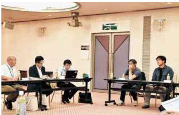
青年部役員との懇談(6月12日)