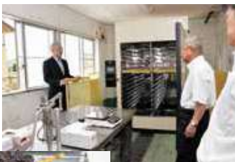
乾燥機の説明を受ける組合長ら

この施設は、JA組合員であれば利用可能です。お問い合わせは西部地区事業部営農課2214799。