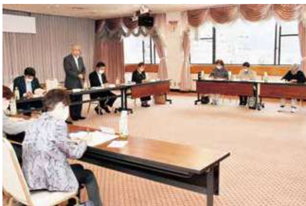
女性部役員との懇談(5月1日)

女性部役員からは、「職員とのコミュニケーションが大切。農業や暮らし、組合員加入について職員からの情報提供や説明が欲しい。部員と共にJAを応援していきたい」との声が寄せられました。