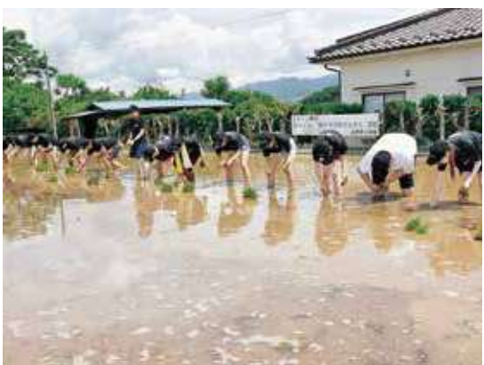
裸足で手植を行う参加者

東京都新宿区のホテル「ヒルトン東京」の総支配人ら30人は6月13日、丸子地区で田植え体験を行いました。2017年から始まった取り組みで、田植え体験をきっかけに同ホテルは管内で栽培された「風さやか」を当JAから仕入れ、和食レストランで提供しています。