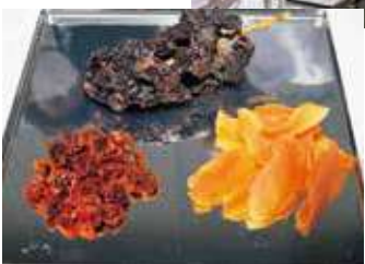
ブドウ ミントマト 中央前 左手前 右手前