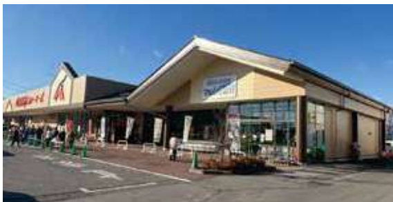
リニューアルするマルシェ国分

今回のリニューアルでは、開店当初から使用してきた冷凍ケースを一新し、より快適で便利な買い物環境を提供します。今後も地域に密着した店舗運営を心掛け、組合員や地域住民に愛される店舗づくりを目指します。