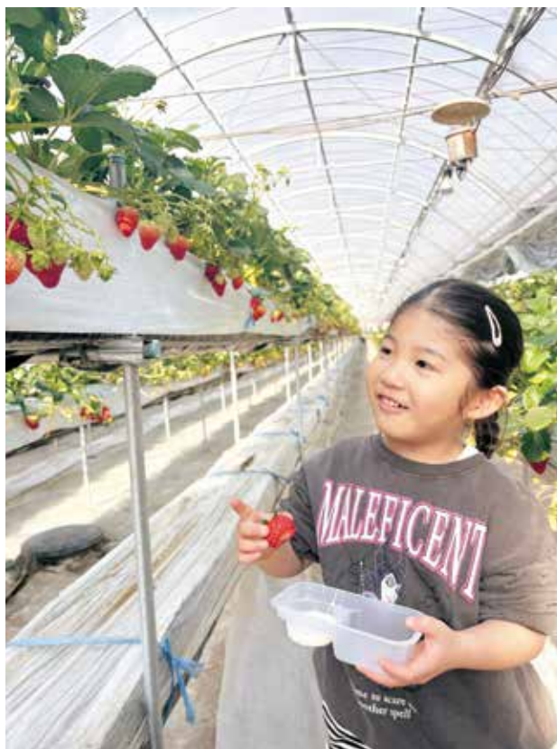
真っ赤なイチゴを前にどれを食べようかと選ぶ来園者

イチゴ狩りは1時間食べ放題の予約制で、練乳付き。予約やお問い合わせは塩田東山観光農園(電話39-0210)または、予約サイト「じゃらん」から。