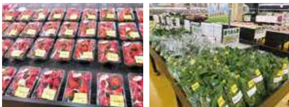
新鮮でみずみずしい生鮮食品